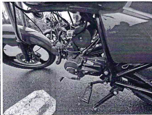
Dok. fot. z dnia 08.12.2025r. fot. nr 18