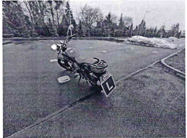
Dok. fot. z dnia 08.12.2025r. fot. nr 2