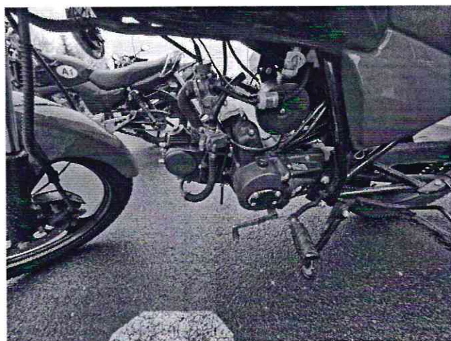
Dok. fot. z dnia 08.12.2025r. fot. nr 17