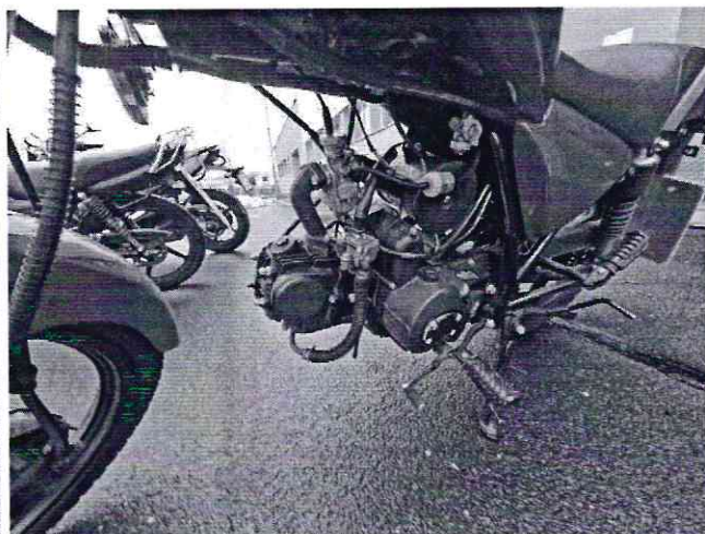
Dok. fot. z dnia 08.12.2025r. fot. nr 16