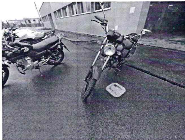
Dok. fot. z dnia 08.12.2025r. fot. nr 3