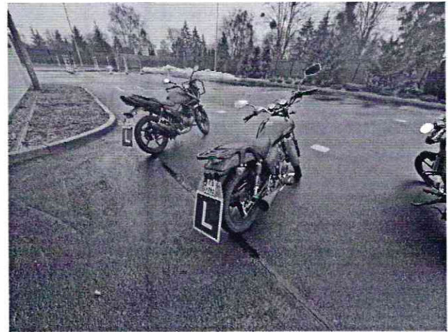
Dok. fot. z dnia 08.12.2025r. fot. nr 4