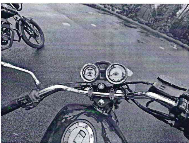
Dok. fot. z dnia 08.12.2025r. fot. nr 11