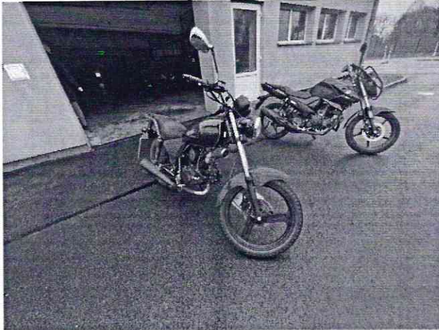
Dok. fot. z dnia 08.12.2025r. fot. nr 1