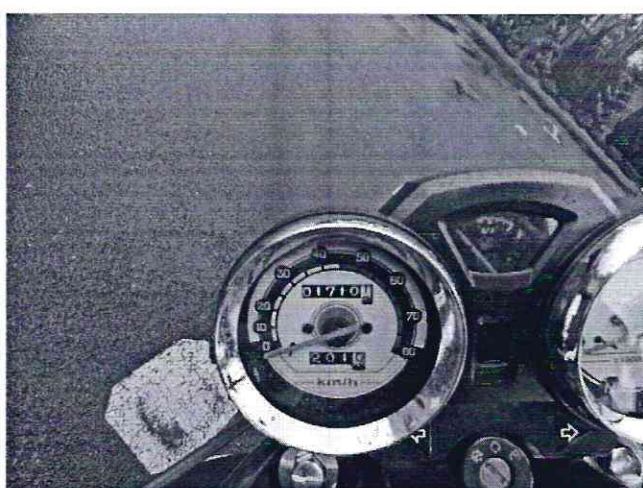
Dok. fot. z dnia 08.12.2025r. fot. nr 12