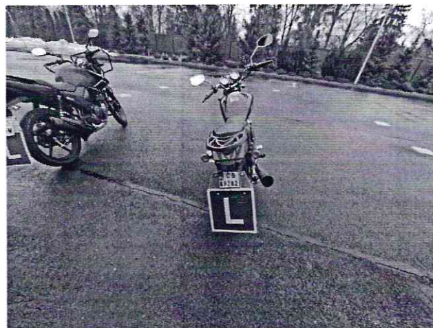
Dok. fot. z dnia 08.12.2025r. fot. nr 5