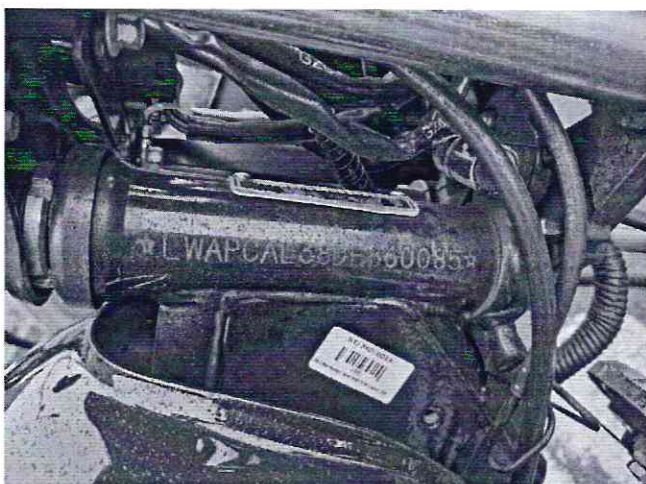
Dok. fot. z dnia 08.12.2025r. fot. nr 9