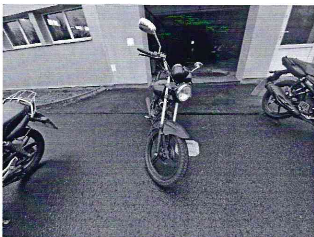
Dok. fot. z dnia 08.12.2025r. fot. nr 7