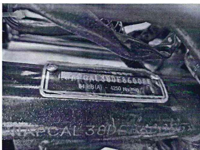
Dok. fot. z dnia 08.12.2025r. fot. nr 10