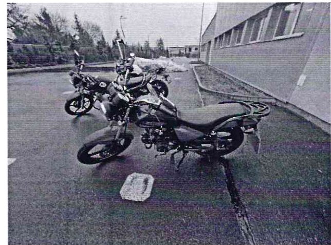
Dok. fot. z dnia 08.12.2025r. fot. nr 6