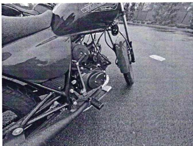
Dok. fot. z dnia 08.12.2025r. fot. nr 15