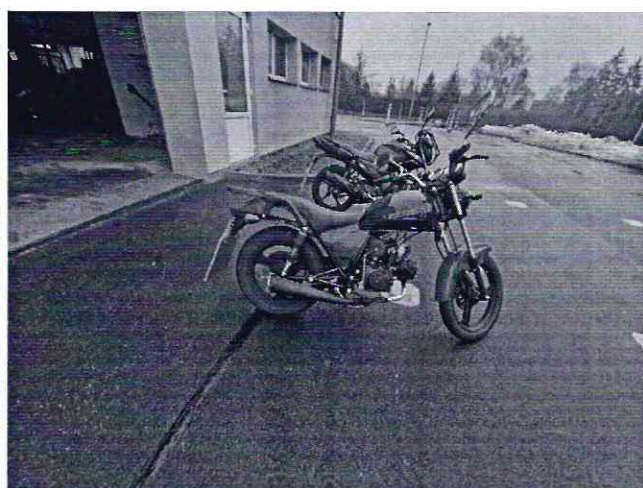
Dok. fot. z dnia 08.12.2025r. fot. nr 8