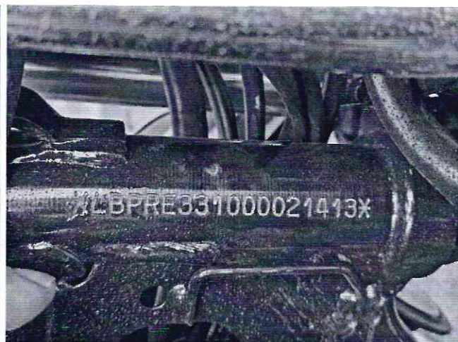
Dok. fot. z dnia 08.12.2025r. fot. nr 10