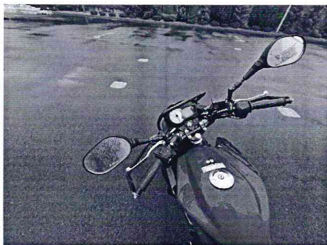
Dok. fot. z dnia 08.12.2025r. fot. nr 12