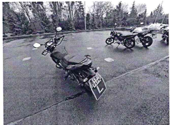
Dok. fot. z dnia 08.12.2025r. fot. nr 2