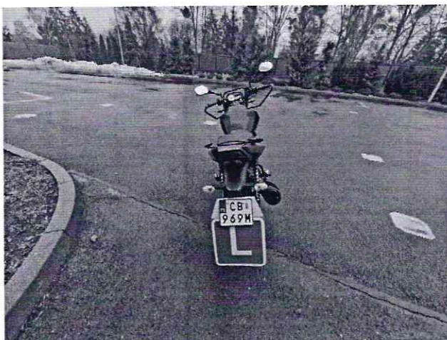
Dok. fot. z dnia 08.12.2025r. fot. nr 5