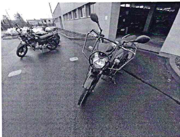
Dok. fot. z dnia 08.12.2025r. fot. nr 3