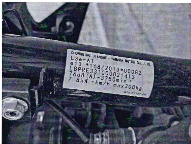
Dok. fot. z dnia 08.12.2025r. fot. nr 9