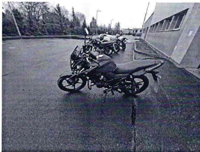
Dok. fot. z dnia 08.12.2025r. fot. nr 8