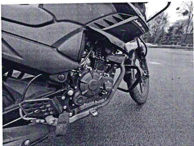
Dok. fot. z dnia 08.12.2025r. fot. nr 13