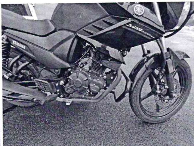
Dok. fot. z dnia 08.12.2025r. fot. nr 14