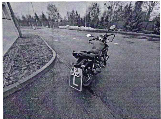
Dok. fot. z dnia 08.12.2025r. fot. nr 4