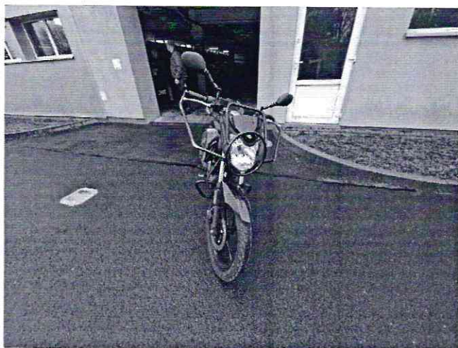
Dok. fot. z dnia 08.12.2025r. fot. nr 7