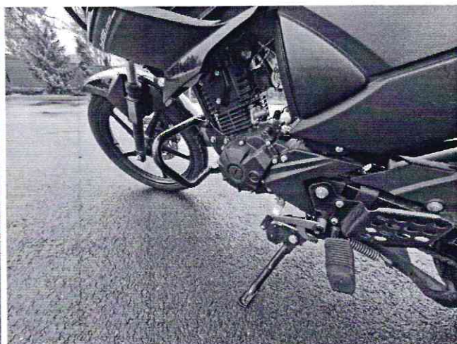
Dok. fot. z dnia 08.12.2025r. fot. nr 18