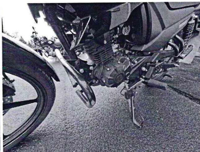
Dok. fot. z dnia 08.12.2025r. fot. nr 16