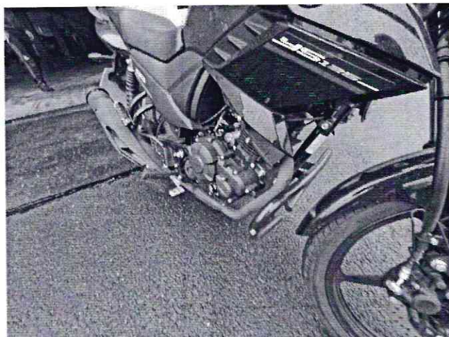
Dok. fot. z dnia 08.12.2025r. fot. nr 15