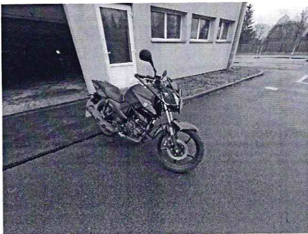
Dok. fot. z dnia 08.12.2025r. fot. nr 1