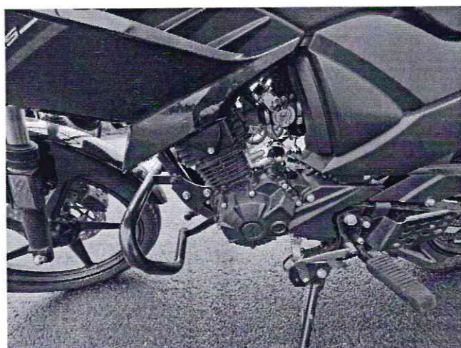
Dok. fot. z dnia 08.12.2025r. fot. nr 17