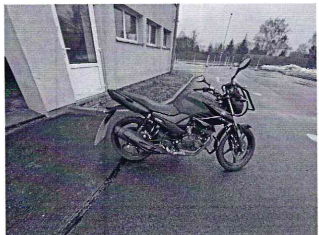
Dok. fot. z dnia 08.12.2025r. fot. nr 6