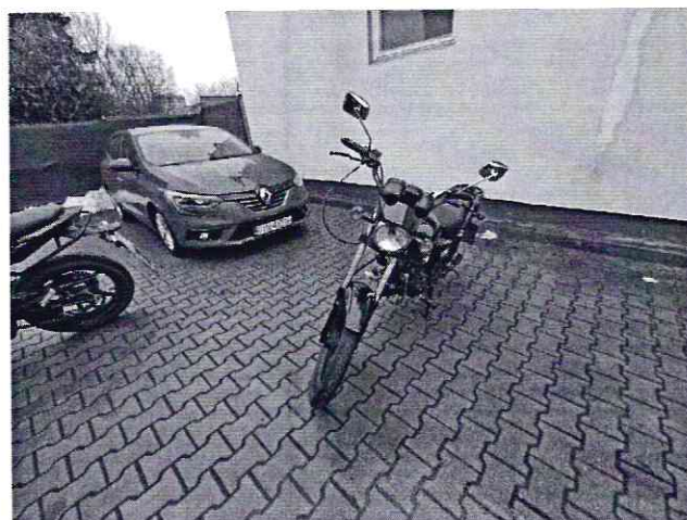
Dok. fot. z dnia 05.12.2025r. fot. nr 3