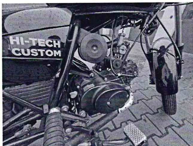
Dok. fot. z dnia 05.12.2025r. fot. nr 15