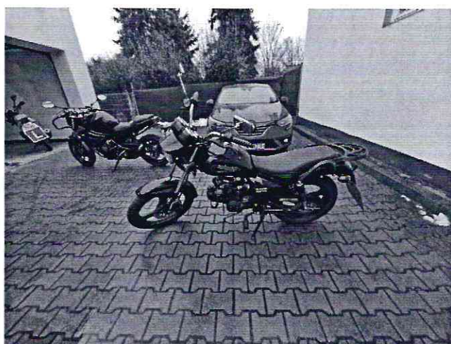
Dok. fot. z dnia 05.12.2025r. fot. nr 8