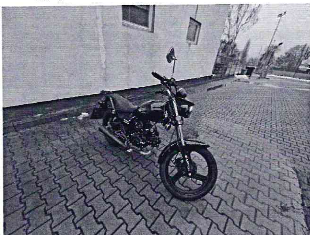
Dok. fot. z dnia 05.12.2025r. fot. nr 1