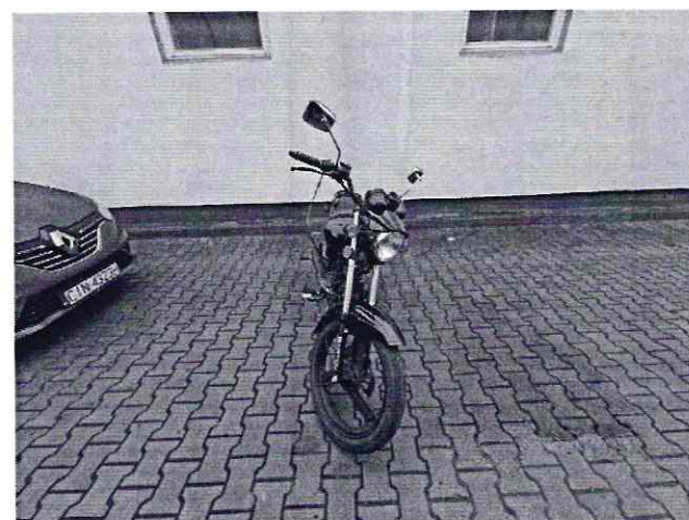
Dok. fot. z dnia 05.12.2025r. fot. nr 5