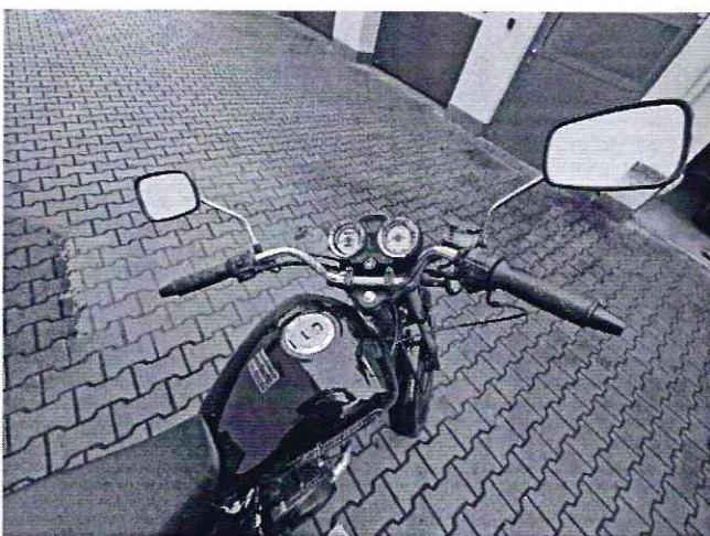
Dok. fot. z dnia 05.12.2025r. fot. nr 11