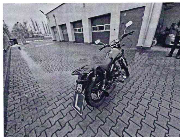
Dok. fot. z dnia 05.12.2025r. fot. nr 4