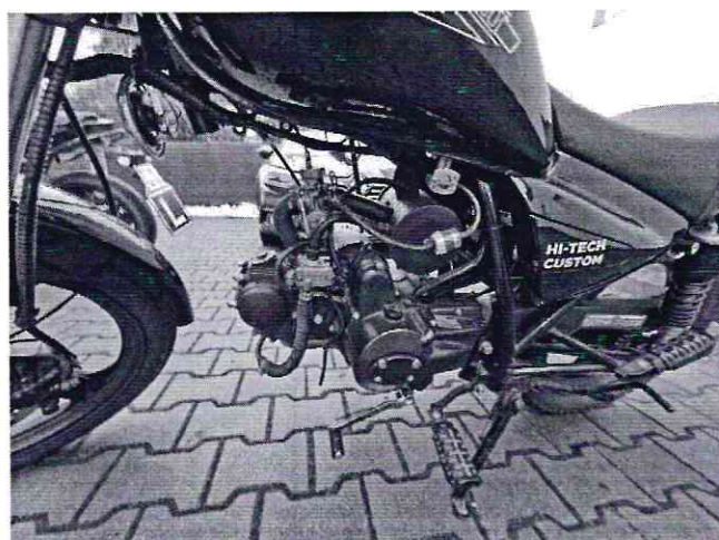
Dok. fot. z dnia 05.12.2025r. fot. nr 17