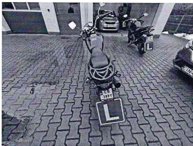
Dok. fot. z dnia 05.12.2025r. fot. nr 7