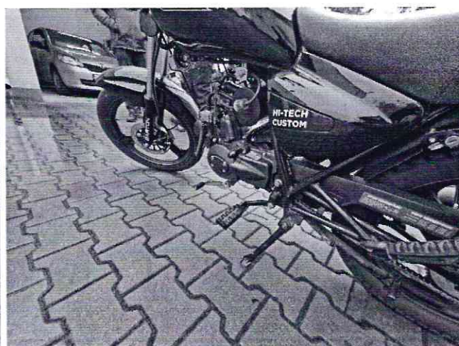
Dok. fot. z dnia 05.12.2025r. fot. nr 18