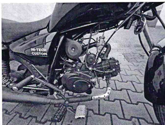
Dok. fot. z dnia 05.12.2025r. fot. nr 14