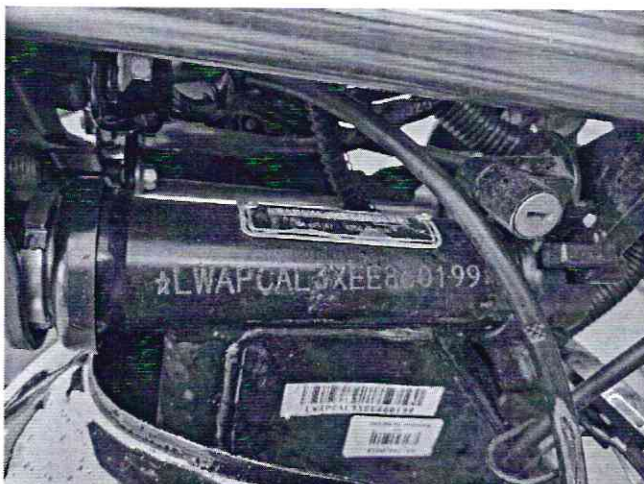
Dok. fot. z dnia 05.12.2025r. fot. nr 9