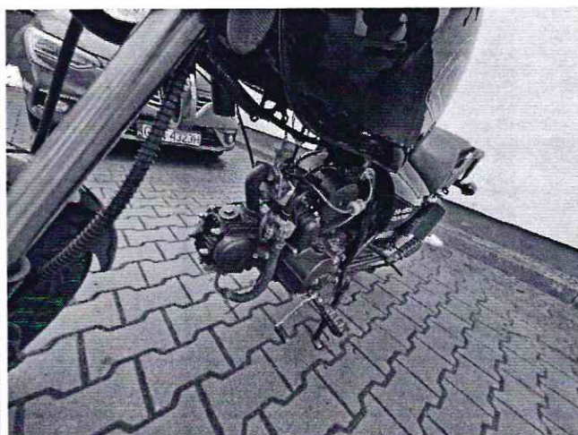
Dok. fot. z dnia 05.12.2025r. fot. nr 16