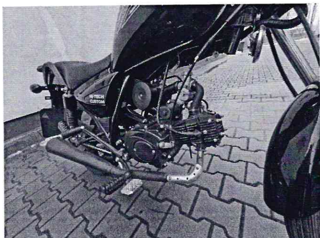
Dok. fot. z dnia 05.12.2025r. fot. nr 13