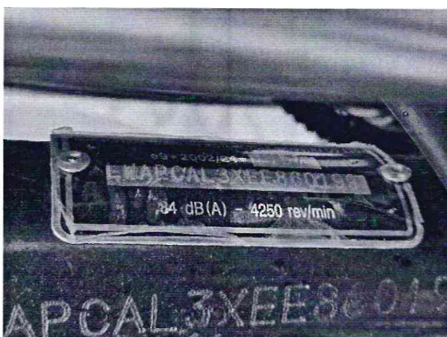
Dok. fot. z dnia 05.12.2025r. fot. nr 10