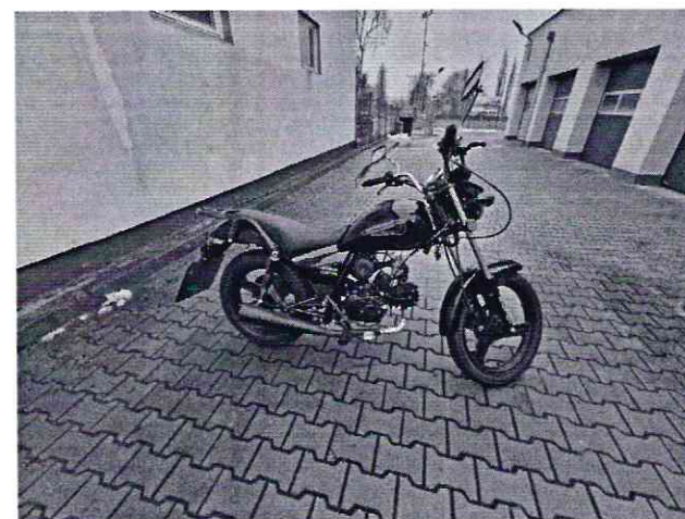
Dok. fot. z dnia 05.12.2025r. fot. nr 6