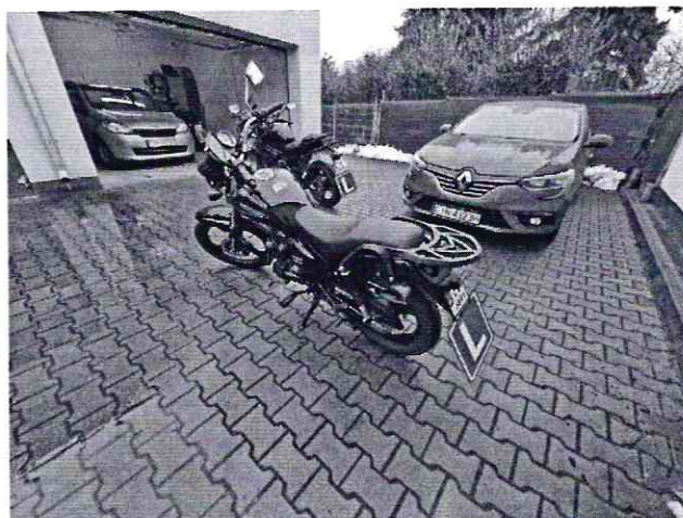
Dok. fot. z dnia 05.12.2025r. fot. nr 2